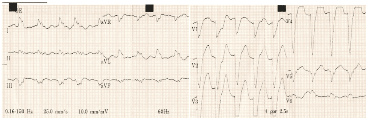
Figura 1: ECG do paciente com bloqueio atrioventricular variável, frequência cardíaca de 125bpm, bloqueio completo de ramo esquerdo. Presença de sobrecarga ventricular esquerda, área eletricamente inativa inferolateral, alterações secundárias de repolarização ventricular