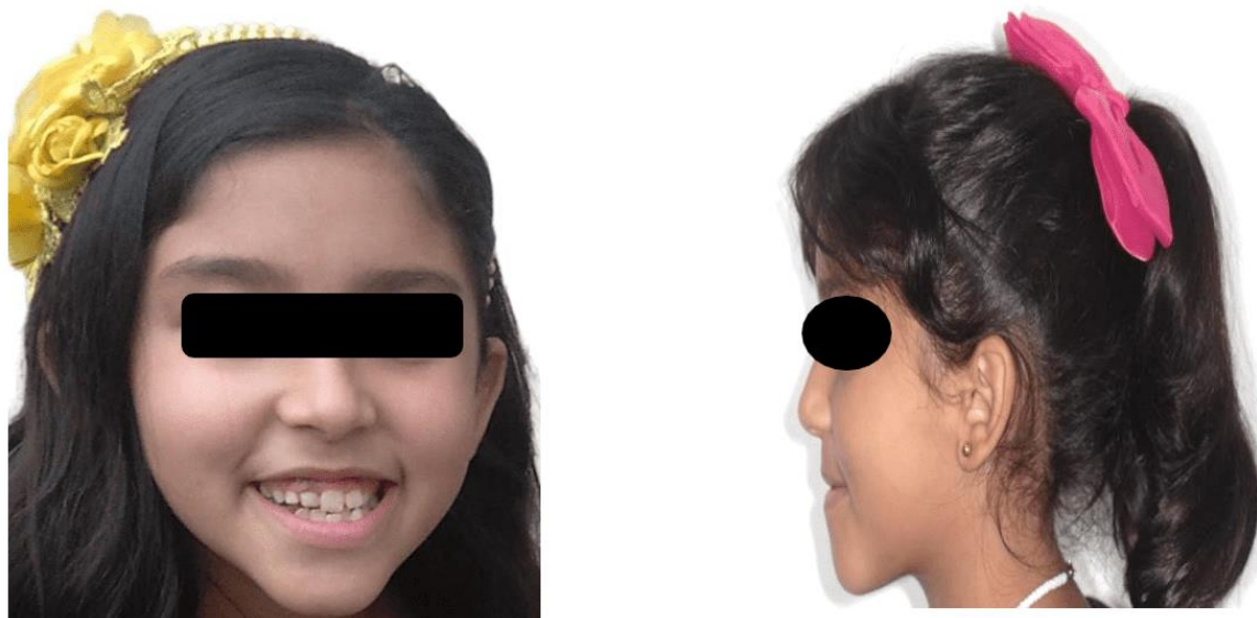
Figura 1: Perfil de la paciente

En el examen extraoral, se observó tercio inferior de la cara aumentado y sellado labial en reposo. La paciente presentaba un patrón facial recto (Figura 1), con una llave de Angle de clase III (cúspide mesio-vestibular del primer molar superior detrás del surco mesio-vestibular del primer molar inferior) y mandíbula protruida.