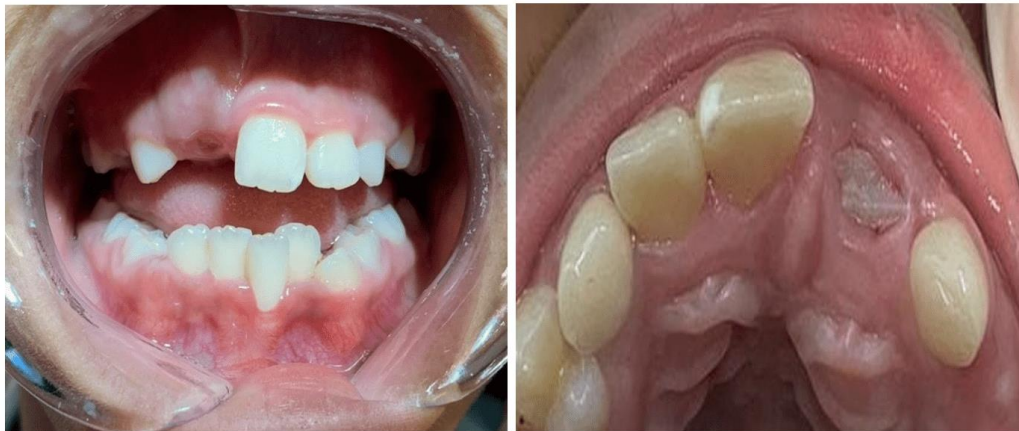
Figura 10: Foto después de 4 meses de uso del aparato