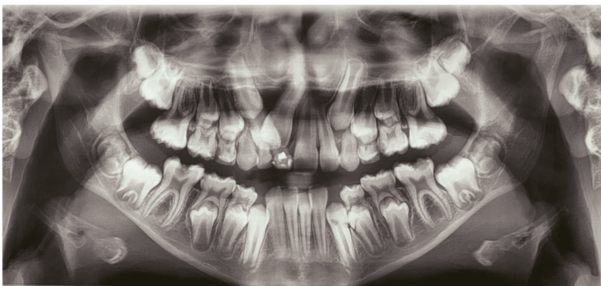
Figura 3: Radiografia Panorâmica