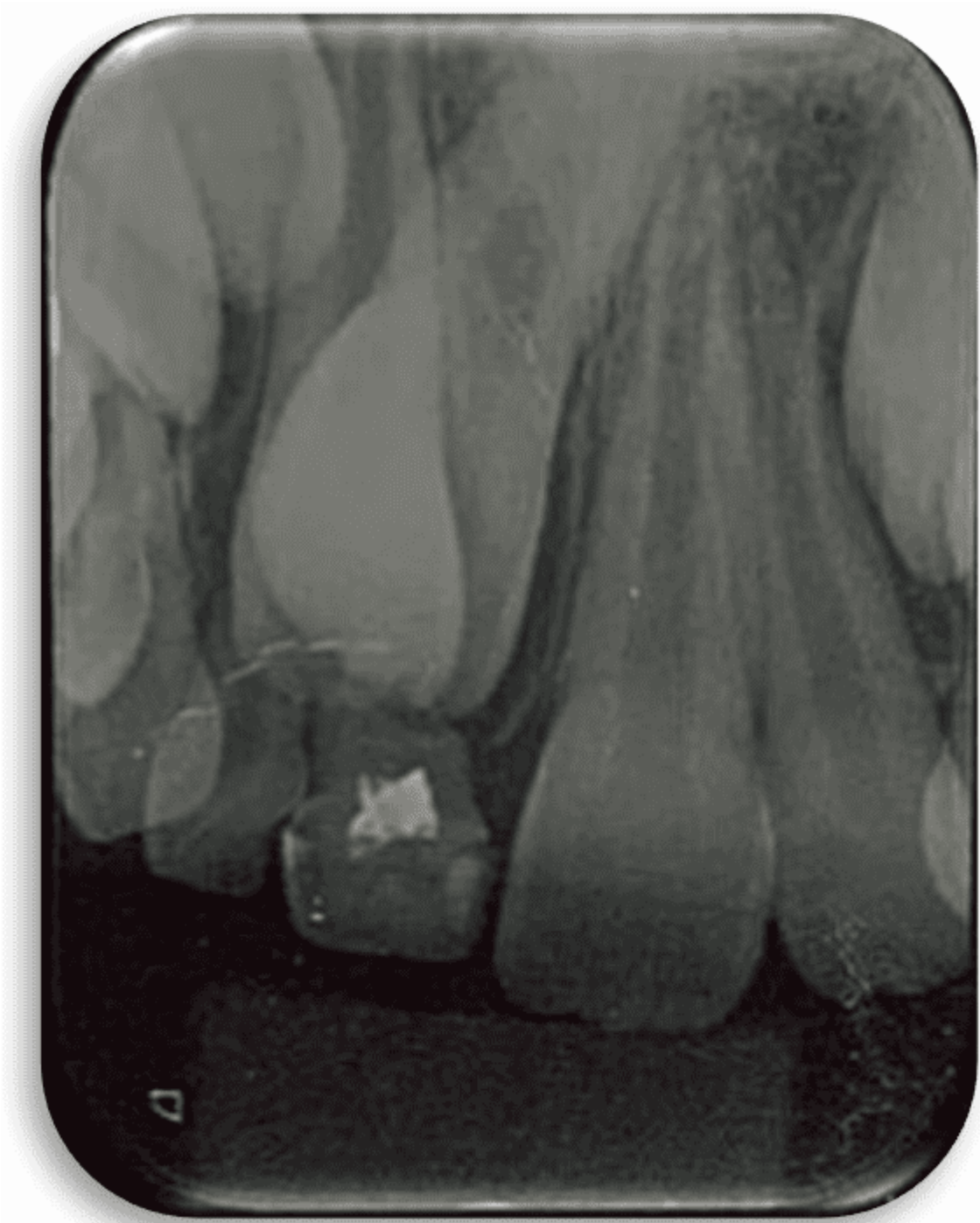
Figura 2: Radiografía periapical de incisivos temporales y permanentes

32, 41, 42 y una aparente impactación de los elementos 11 y 12 que se encontraban en el estadio 9 de Nolla (Figura 2 y 3).