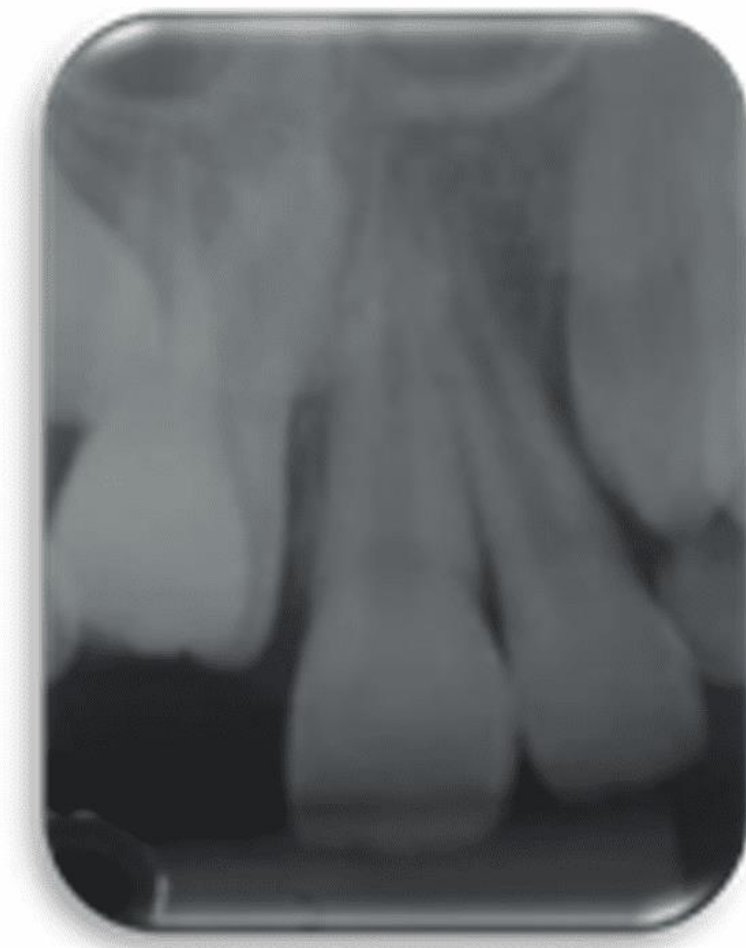
Figura 11: Radiografía periapical después de 4 meses de uso del aparato