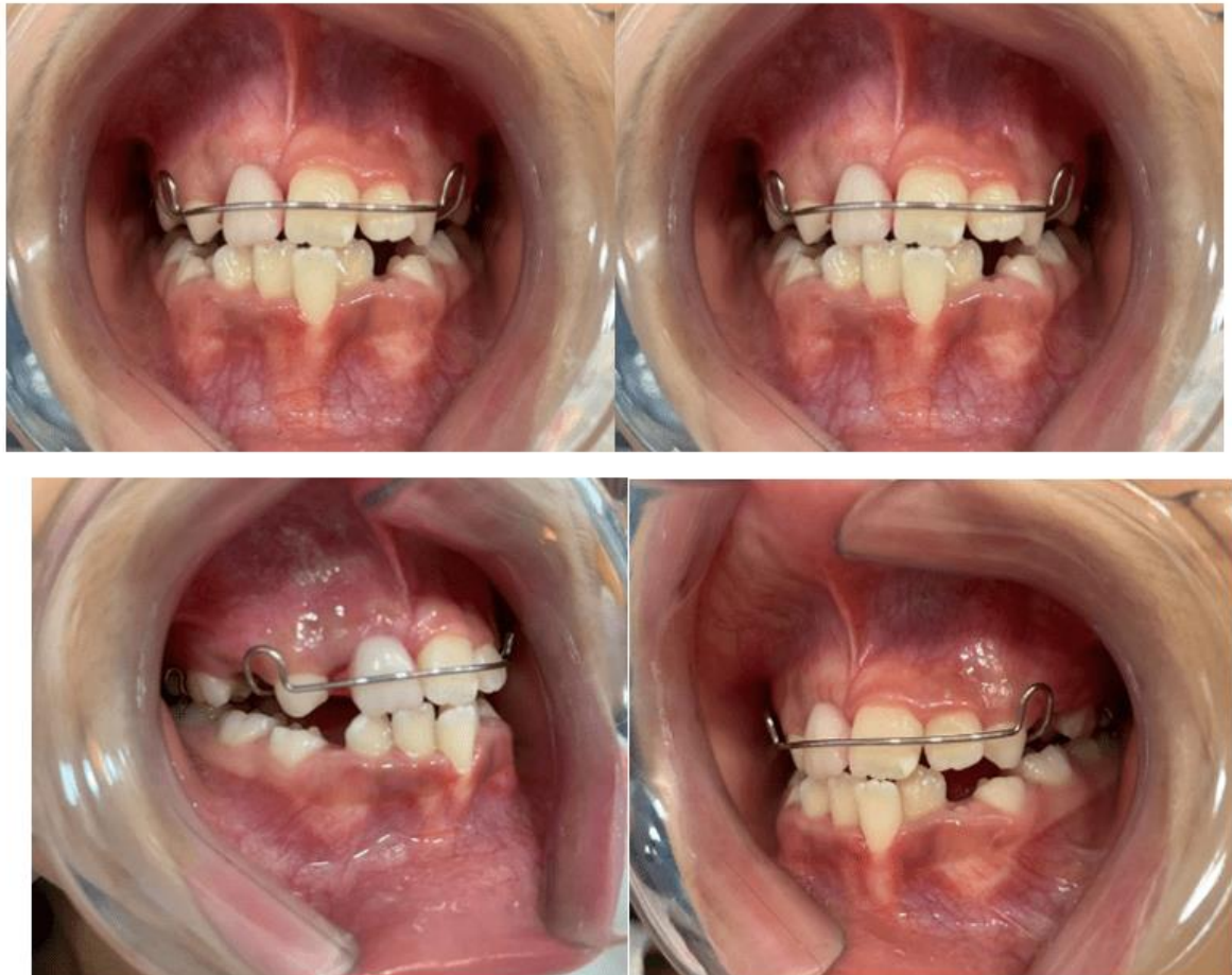
Figura 6: Instalação del Mantenedor de espacio estético funcional