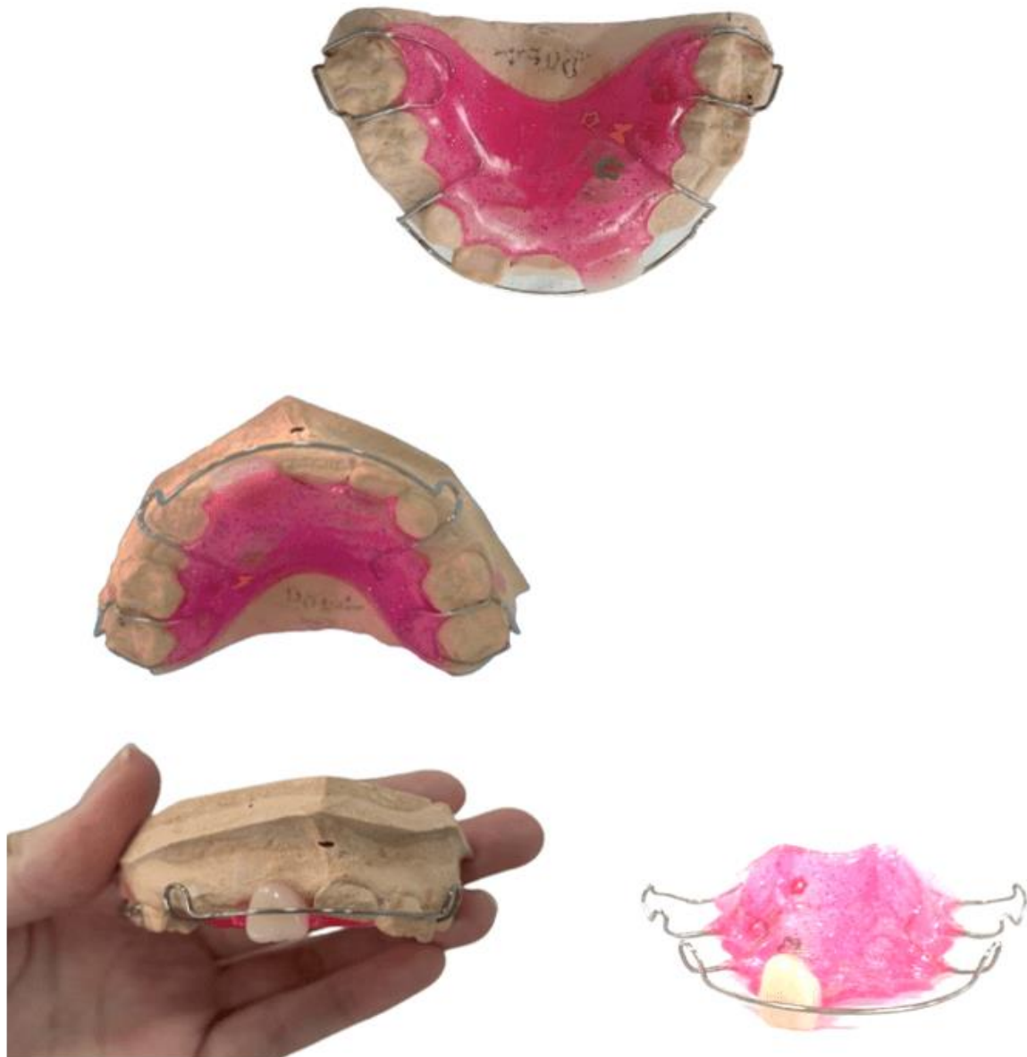
Figura 5: Mantenedor de espacio estético funcional removible