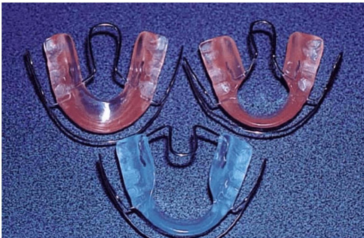
Figura 3 – Tipos de aparelho Bionator de Balters