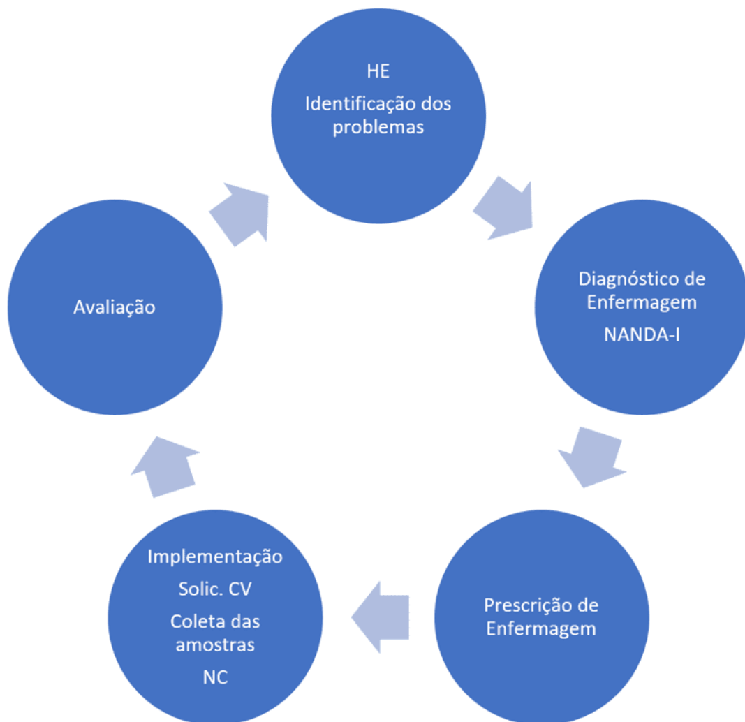
Figura 1 –Processo de Enfermagem

Processo de Enfermagem (PE) realizou-se em 5 etapas inter-relacionadas, utilizando a Teoria de Horta e a Taxonomia da North American Nursing Diagnosis Association (NANDA – I) para fundamentação dos diagnósticos (HORTA, 1979; HERDMAN, 2021).