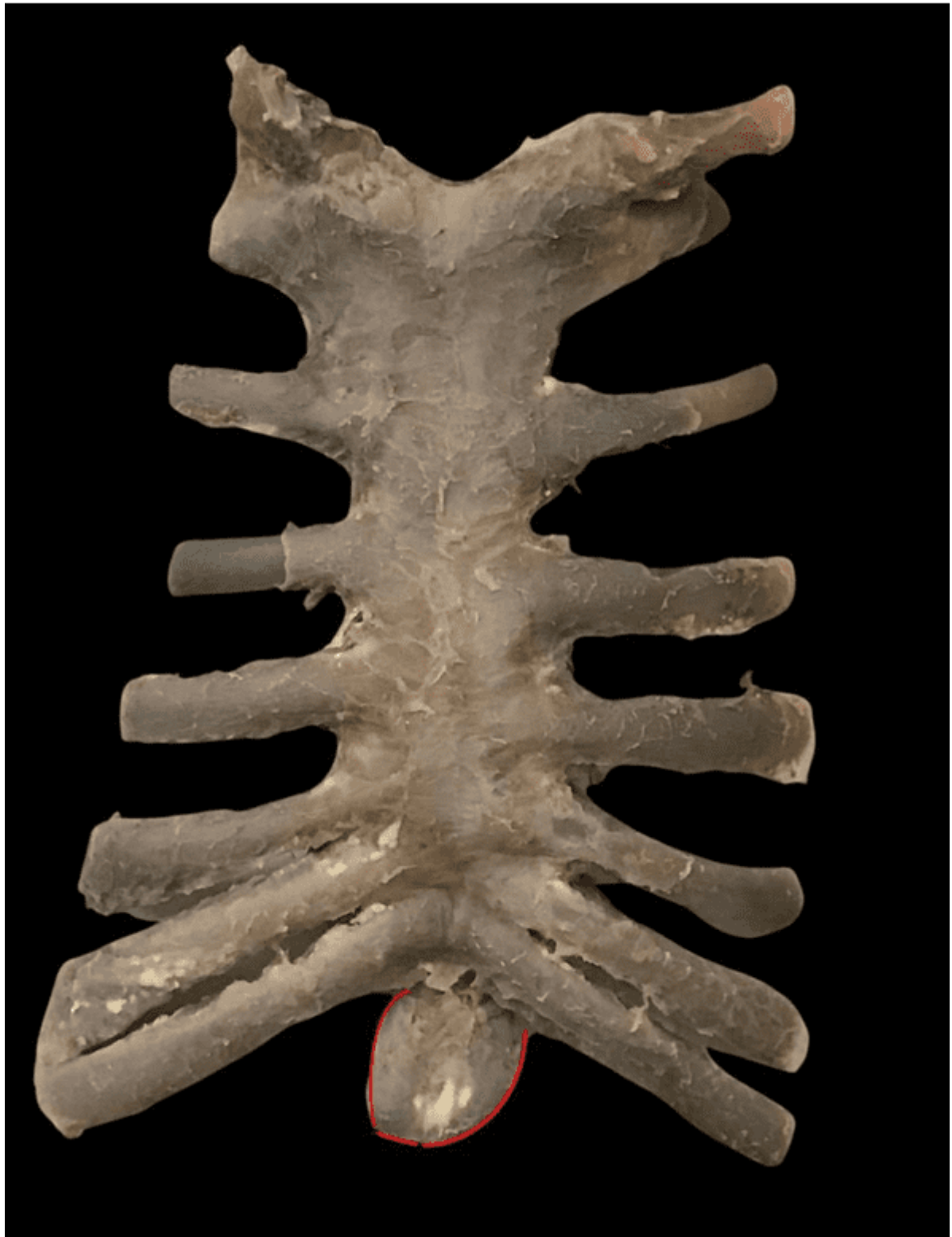
Figura 1. Vista ventral del esternón muestra una concavidad y angulación del esternón del esternón