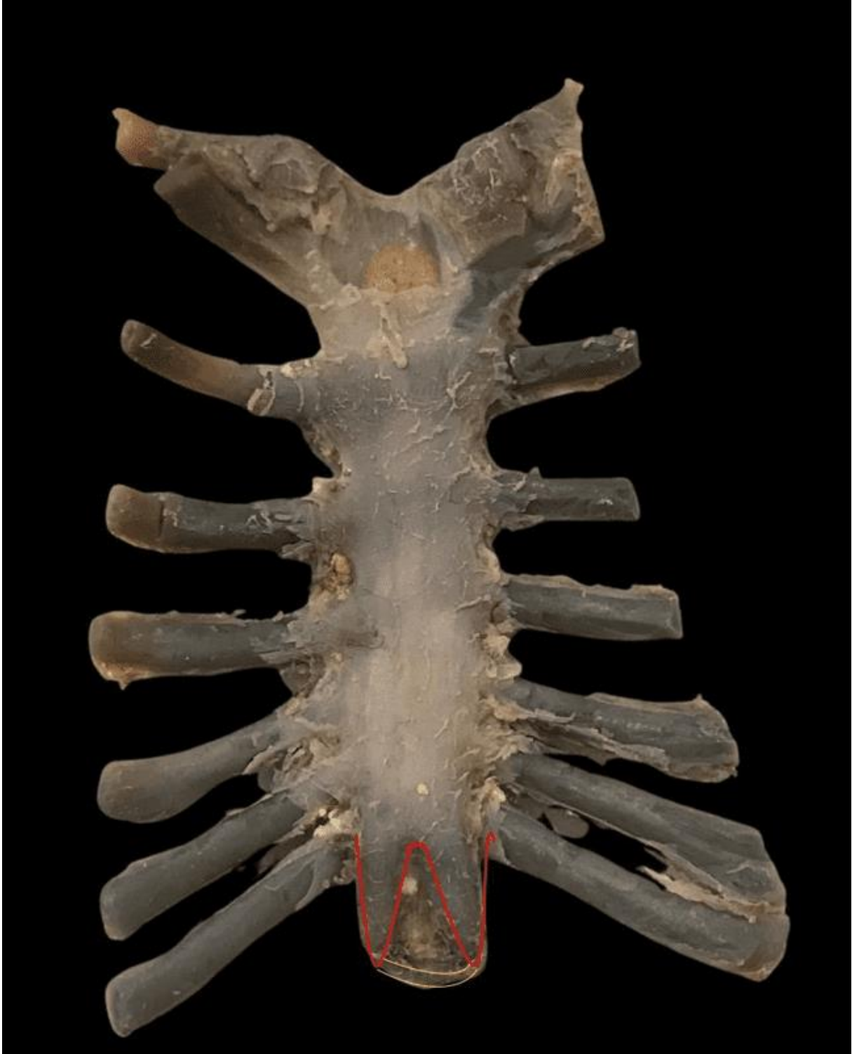
Figura 2. Vista dorsal del esternón mostrando los dos procesos xifoides separados por tejido conectivo y sin foramen visible a simple vista