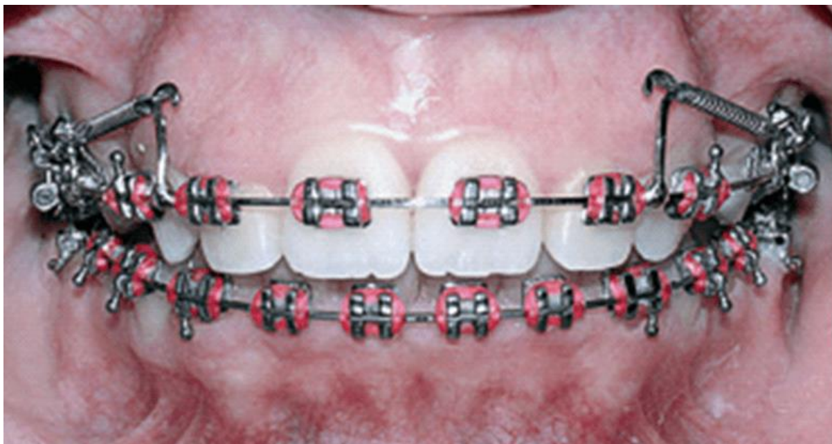
FIGURA 2 - Retração anterior com vetor de força extrusivo para os incisivos superiores