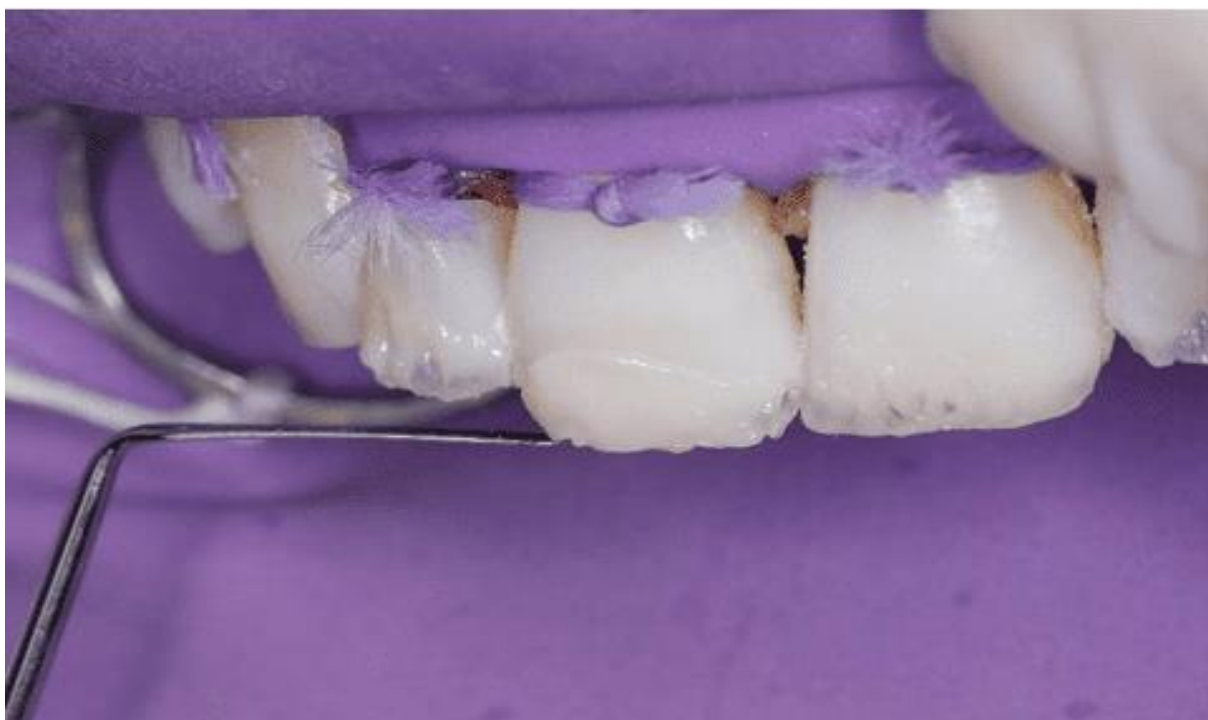
Figura 12 – Incremento camada de esmalte