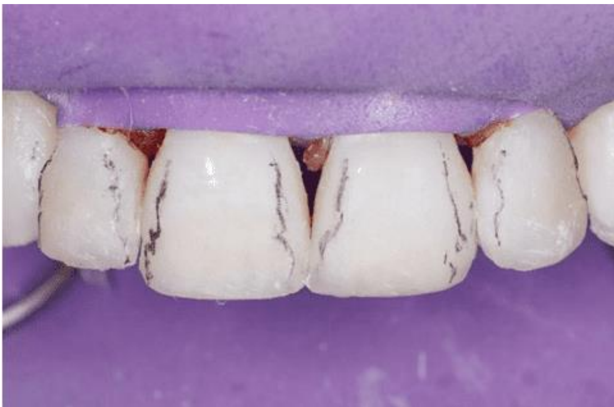
Figura 14 – Demarcação das arestas

Em seguida foi feita a demarcação das arestas proximais com uma lapiseira para facilitar o procedimento de acabamento das regiões incrementadas com resina composta (Figura 14) utilizando um disco Praxis (TDV Dental, Pomerode, SC, Brasil) para realizar os desgastes (Figura 15).