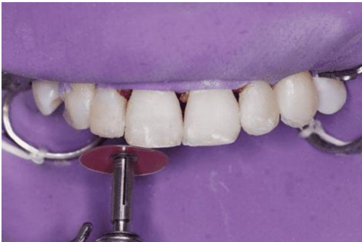
Figura 15 – Acabamento com disco de lixa