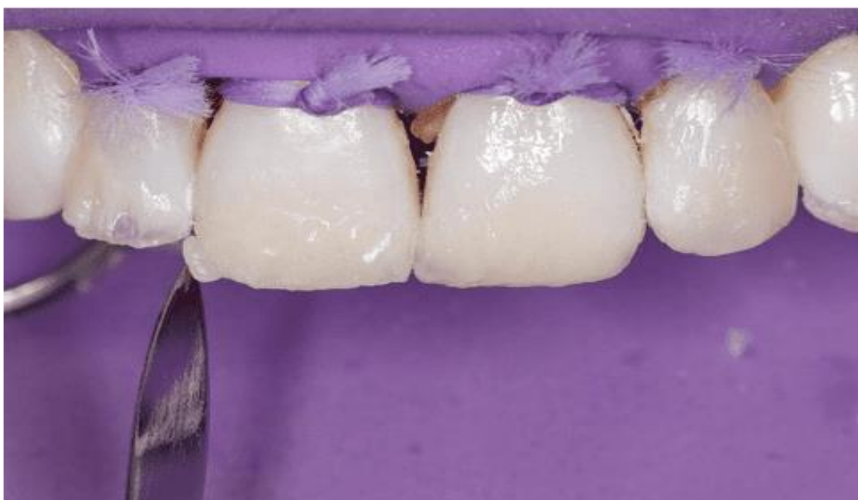
Figura 13 – Incremento camada de esmalte