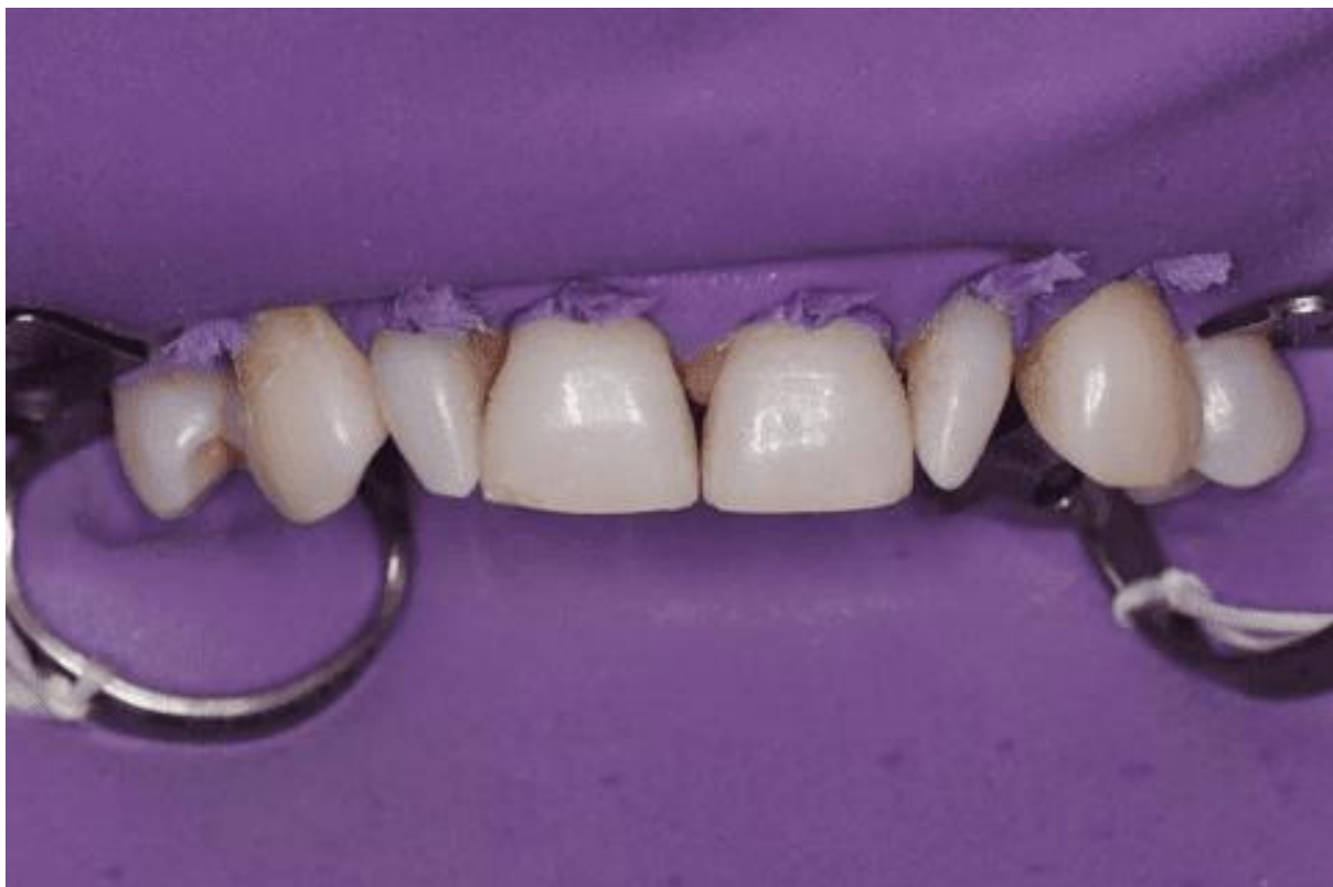
Figura 5 – Isolamento Absoluto