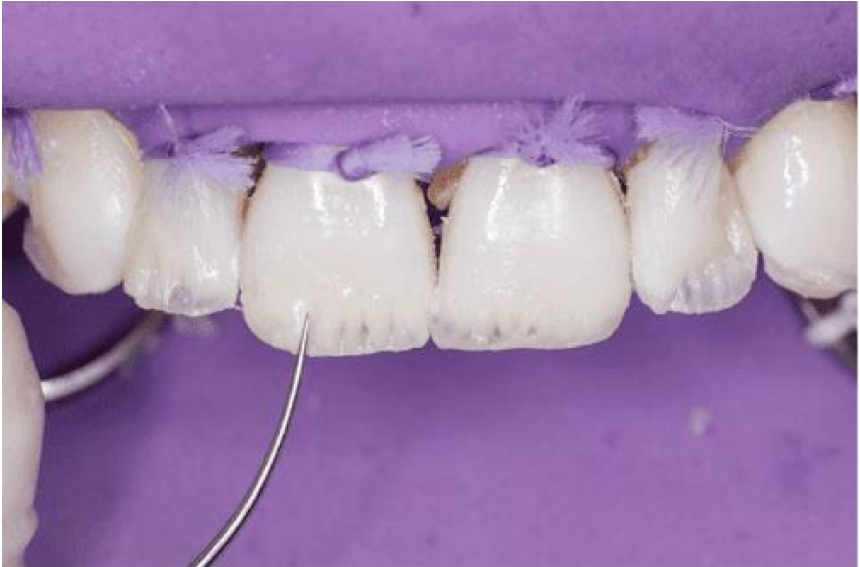
Figura 11 – Escultura camada de dentina