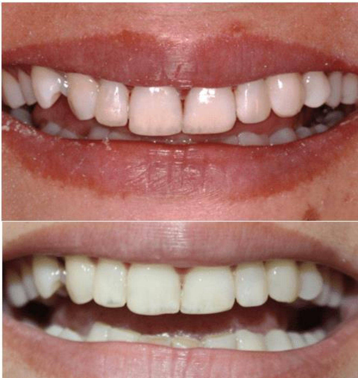
Figura 18 – Fotografia aspecto final imediato das restaurações

Após as etapas de acabamento e polimento, foi feita a retirada do isolamento absoluto e hidratação dos elementos, sendo assim obtido o aspecto final do trabalho em resina composta (Figura 18).