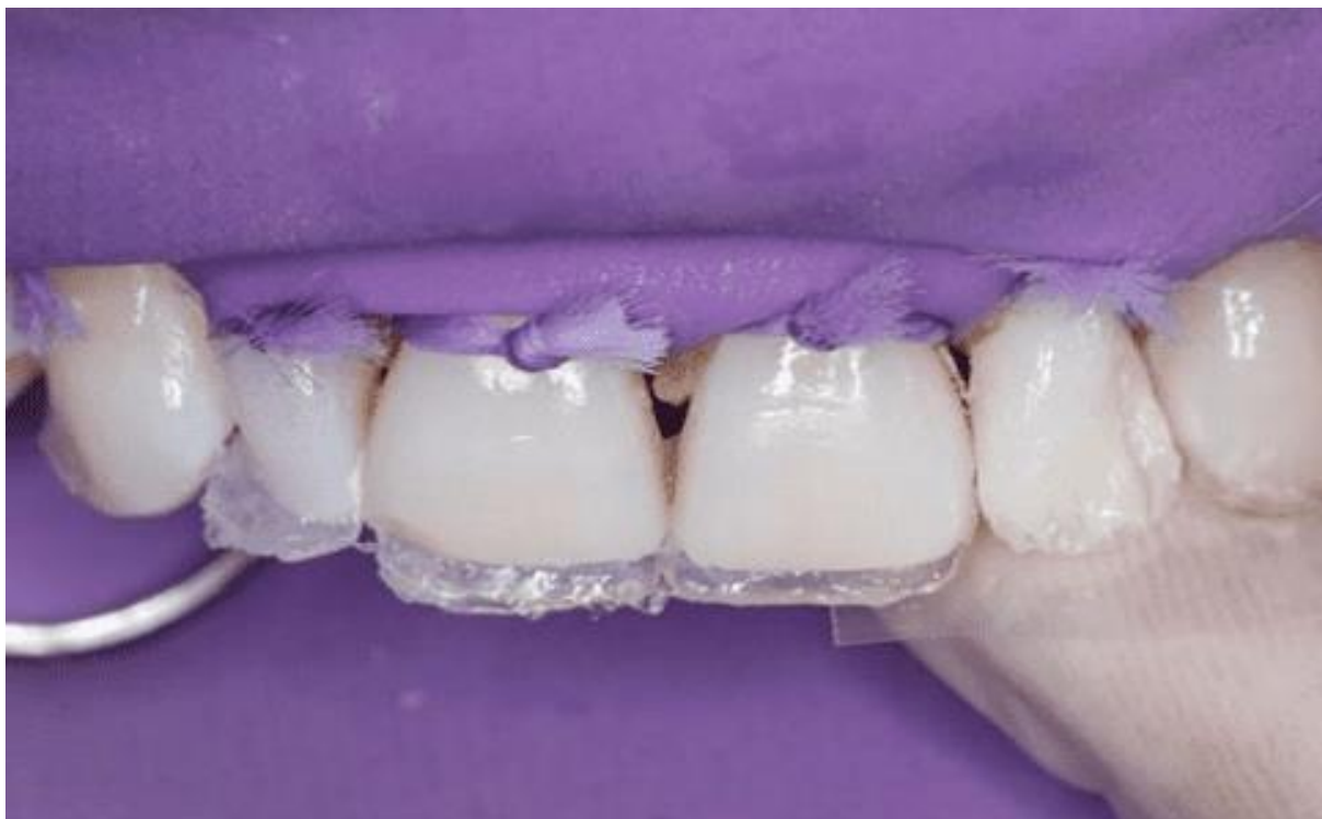
Figura 9 –Fotografia com a construção da concha palatina