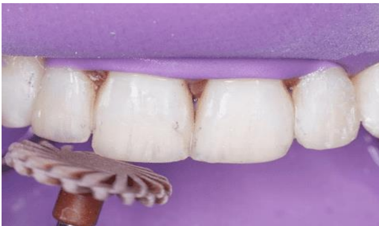
Figura 17 – Polidores diamantados