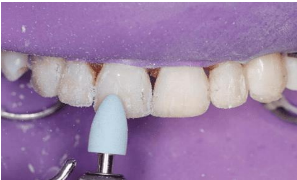
Figura 16 – Polidores granulometria grossa