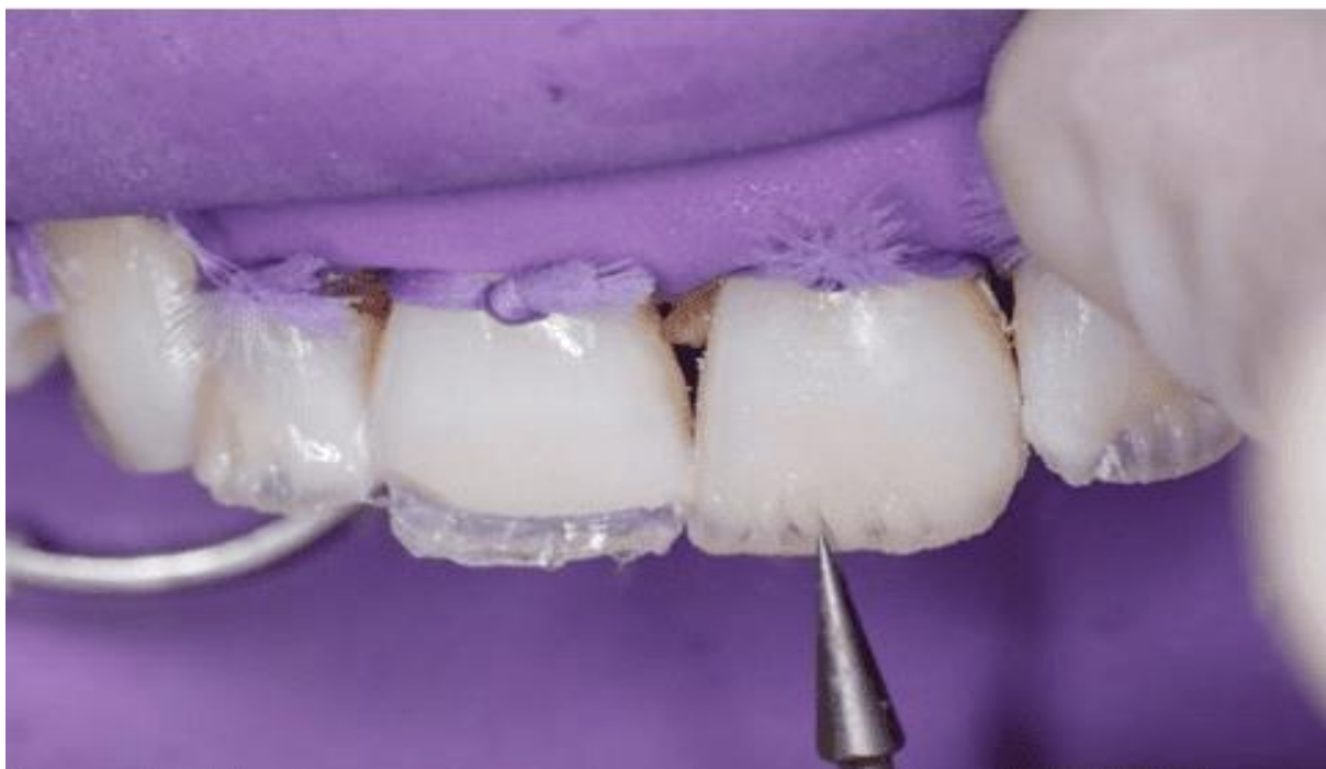
Figura 10 – Escultura camada de dentina