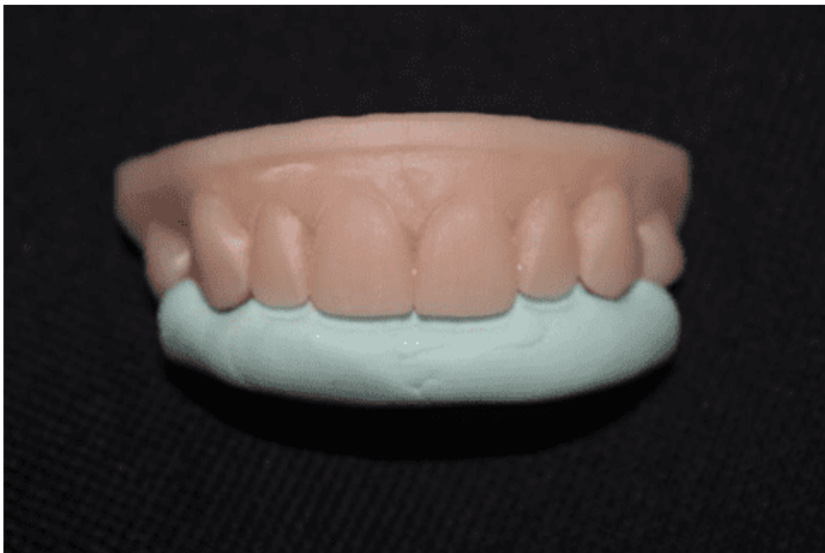
Figura 4 – Prova da guia de silicone no modelo 3D