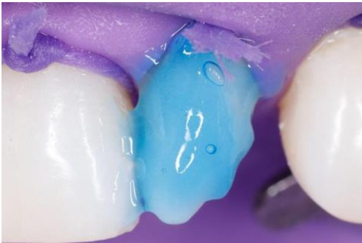
Figura 7 – Condicionamento ácido fosfórico 37%