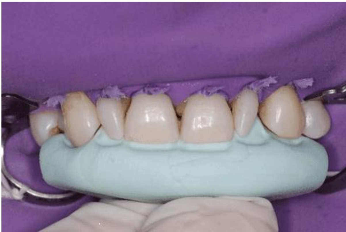
Figura 6 – Adaptação da matriz de silicone