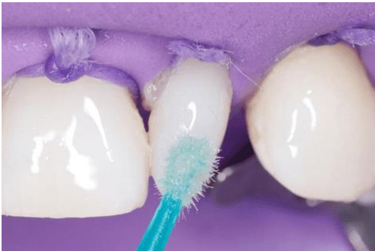
Figura 8 – Aplicação sistema adesivo universal