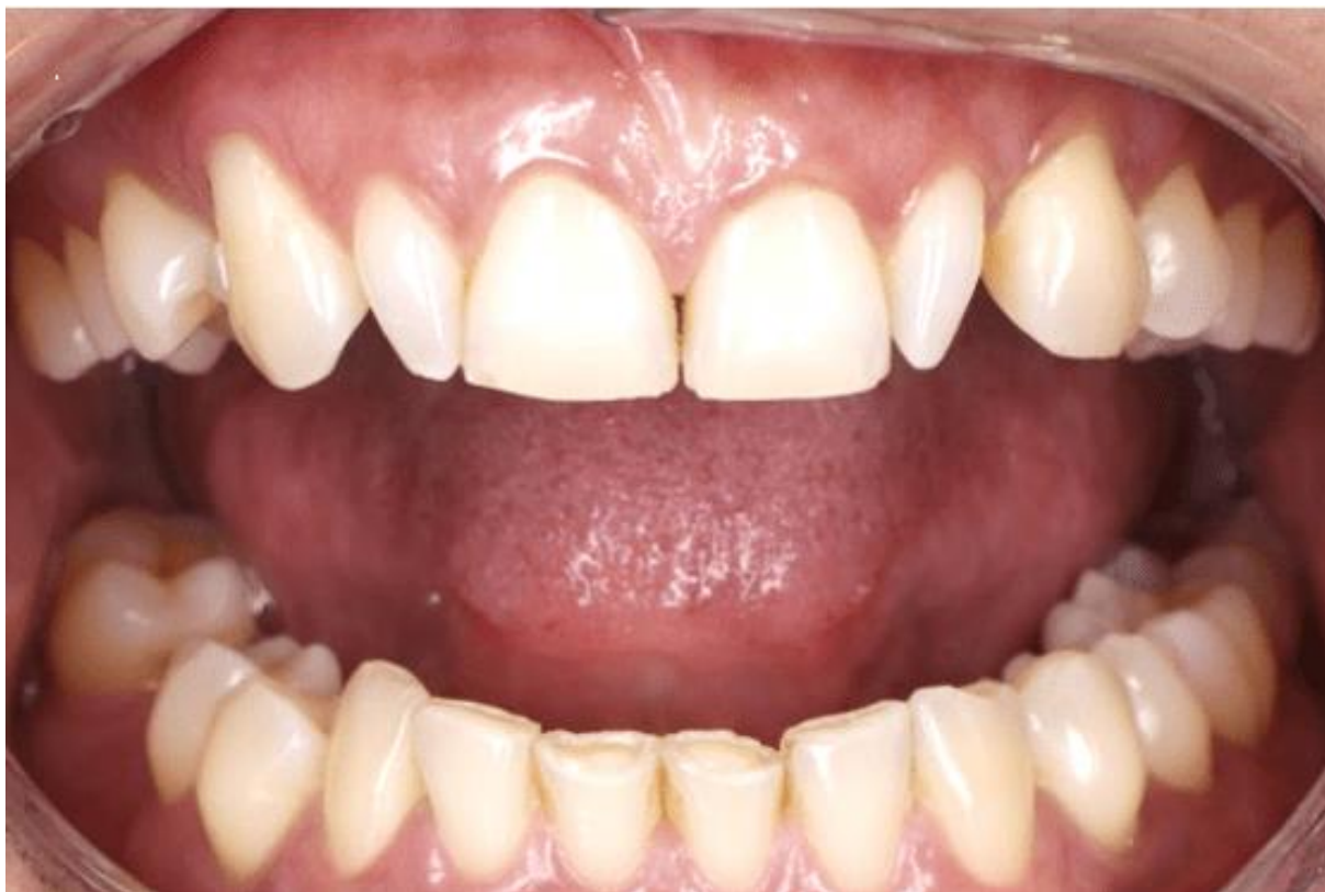
Figura 1- fotografia intrabucal frontal inicial da paciente