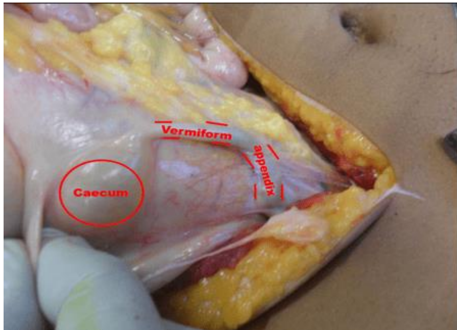
Figura 2. Apêndice vermiforme em posição retrocecal