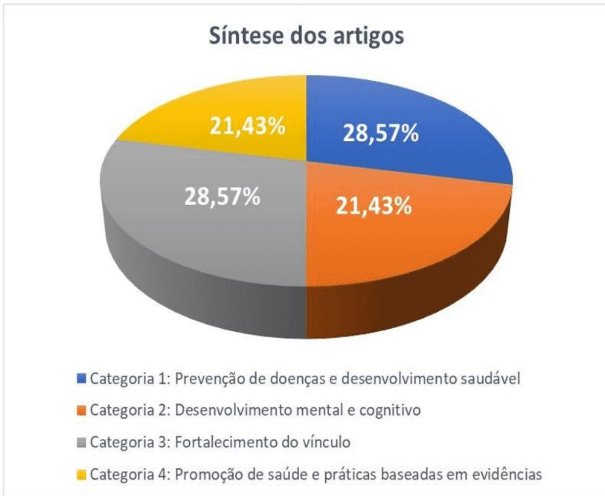
Figura 1- Artigos selecionados de acordo com a categoria temática. Três Lagoas, 2021