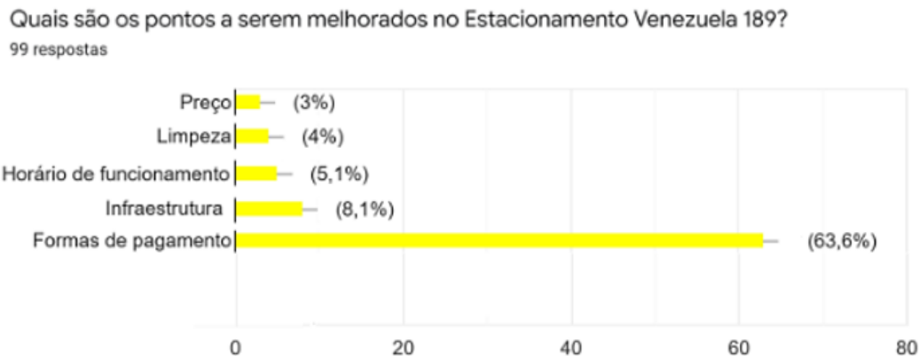
Gráfico 2 - Principais pontos de melhoria apontados pelos clientes

O grande retorno dos pontos positivos é o alcance do prestígio e reconhecimento dos clientes sobre o estacionamento. A credibilidade agregada ao reconhecimento é capaz, também, de fidelizar a clientela e torná-la em uma propagadora espontânea. Como consequência dessas ações, é possível conquistar novos clientes. Desse modo, pode-se concluir que empresas que excedem a expectativa do consumidor alcançam mais facilmente a satisfação e a fidelização do público. Um cliente altamente satisfeito torna-se um porta-voz fiel e fidelizado do serviço (SEBRAE, 2015).