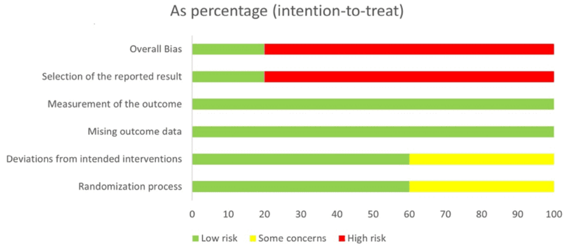
Abbildung 2.1 – Prozentsatz des Bias-Risikos in der Grafik

Quelle: Original Ergebnisse aus der bewertenden Analyse der Autoren dieser Übersicht. Zugang, um mehr über das Werkzeug Risk of Bias-2 (ROB-2) zu erfahren: STERNE, Jonathan A. C., et al. RoB 2: ein überarbeitetes Instrument zur Bewertung des Bias-Risikos in randomisierten Studien. BMJ , Bd. 366, Nr. 14898, 8. 2019. Verfügbar unter: https://doi.org/10.1136/bmj.14898 Zugriff: 06.11.2021. Werkzeug-Download-Link: https://www.riskofbias.info/ Bildunterschrift: Diagrammthemen: in Prozent (Intention to Treat): allgemeine Voreingenommenheit, Ergebnis Auswahl, Ergebnismessung, verpasste Ergebnisse, Abweichungen von beabsichtigter Intervention, Randomisierung Prozess. Farben: rot; hohes Bias-Risiko, gelb; einige Bedenken, grün; keine Risiken. [/caption]