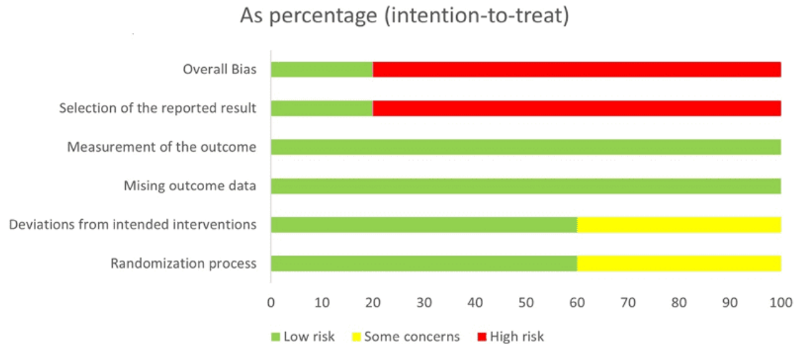
Figura 2.1 - Porcentajes de riesgo de sesgo en el gráfico

Acceda para obtener más información sobre la herramienta Risk of Bias-2 (ROB-2): STERNE, Jonathan A. C., et al. RoB 2: una herramienta revisada para evaluar el riesgo de sesgo en ensayos aleatorios. BMJ , vol. 366, núm. 14898, agosto. 2019. Disponible en: https://doi.org/10.1136/bmj.14898 Consultado: 06/11/2021. Enlace de descarga de la herramienta: https://www.riskofbias.info/ Leyenda: temas del gráfico: en porcentajes (intención de tratar): sesgo general, selección de resultados, medición de resultados, resultados perdidos, desviaciones de la intervención prevista, proceso de aleatorización. Colores: rojo; alto riesgo de sesgo, amarillo; algunas preocupaciones, verde; sin riesgos[/caption]