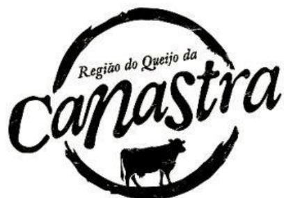
Figura 2 - Identidade Visual da Marca Região do Queijo da Canastra.

Com base nisso, foram desenvolvidos identidade visual, verbal, site , e até uma web-série contando a história dos produtores. Além disso, também foi elaborado um planejamento de implantação da marca no período de 2015 a 2018 (2DA, 2015). A Figura 2 apresenta a ilustração da logo desenvolvida para a marca, bem como exemplos de aplicação dela.